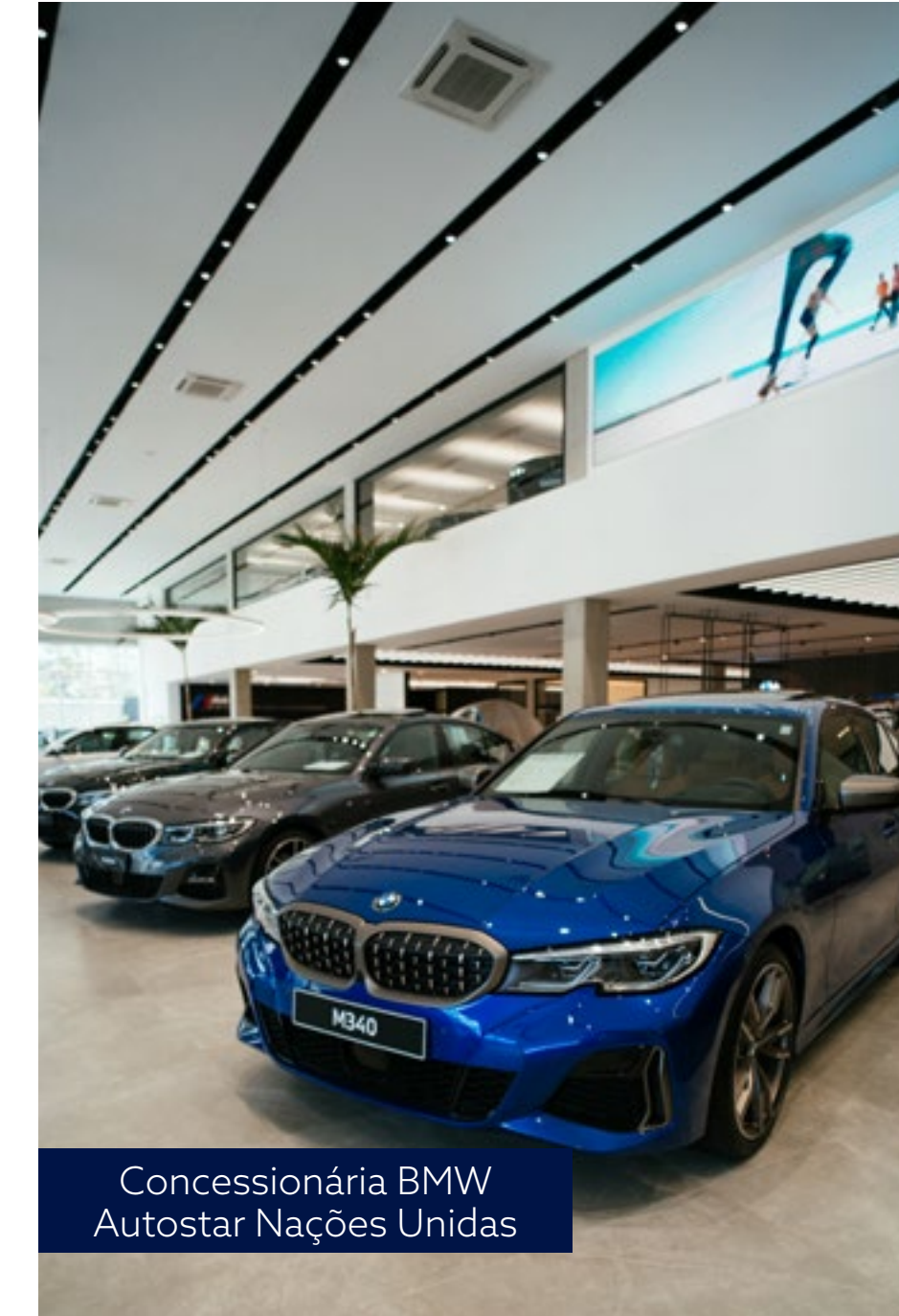
Concessionária BMW Autostar Nações Unidas

Nesse cenário, a Automob apresentou desempenho acima da média do setor. Entre os seminovos, a Companhia alcançou 16.918 unidades comercializadas, 22% mais que em 2022, enquanto, segundo informações da Federação Nacional da Distribuição de Veículos Automotores (Fenabrave), o mercado nacional foi de 10,7 milhões de unidades comercializadas, crescimento de 4,81%. Já considerando automóveis e comerciais leves novos, houve aumento vendas na Automob de 25% em relação a 2022, o que representa 4.897 unidades. A média nacional do setor cresceu, na mesma comparação, 11,3%, somando 2.179.363 emplacamentos, de acordo com a Fenabrave.